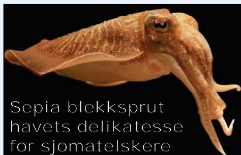
Sepia blekksprut havets delikatesse for sjomatelskere

levde og la det så til tork. For videre produksjon av blekk eller maling, ble den tørkede væsken malt opp til pulver og deretter løst opp i vann ved hjelp av ammoniakk. For å forbedre bindeevnen ble gum arabic eller skjellakk tilsatt. I begynnelsen på 1900 ble det oppdaget en kunne utvinne stoffet som faktisk var ansvarlig for fargen ved hjelp av kaliumhydroksid og saltsyre. Dette resulterte i en farge med