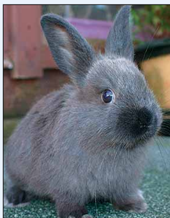
Zobel er en trivelig kanin med godt gemytt og som mødre er de aller fleste perfekte