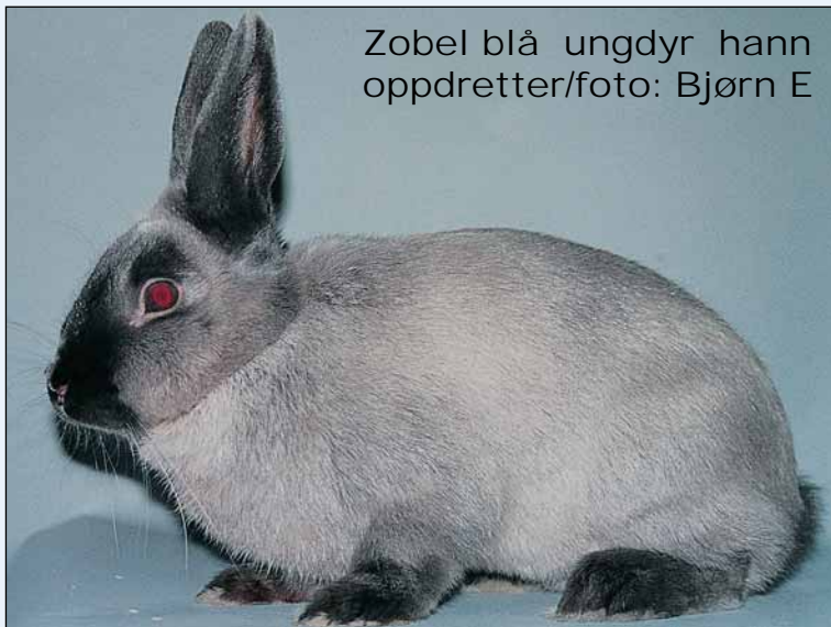
Zobel blå ungdom hann oppdretter/foto: Bjørn E

Ut fra Zobel-historikken så kan det se ut for det var den brune, eller jeg sier det litt mer spennende; den sepia-fargede som ble fremavlet av 3 oppdrettere, mens den blå ser ut for å ha vist seg først i Frankrike