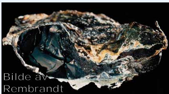
Bilde av Rembrandt