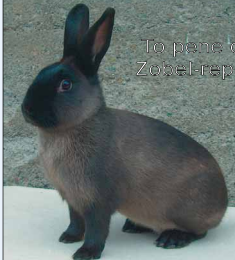
To pene og «våkne» Zobel-representanter