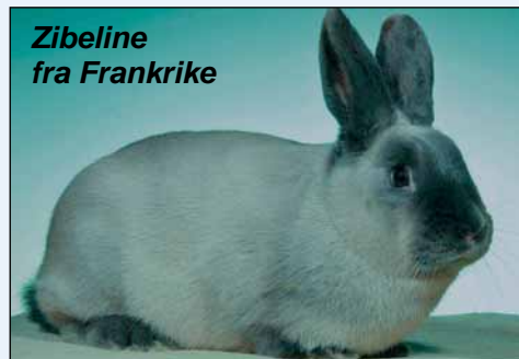
Zibeline fra Frankrike