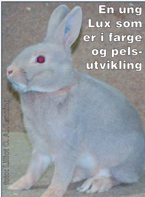
En ung Lux som er i farge og pels- utvikling