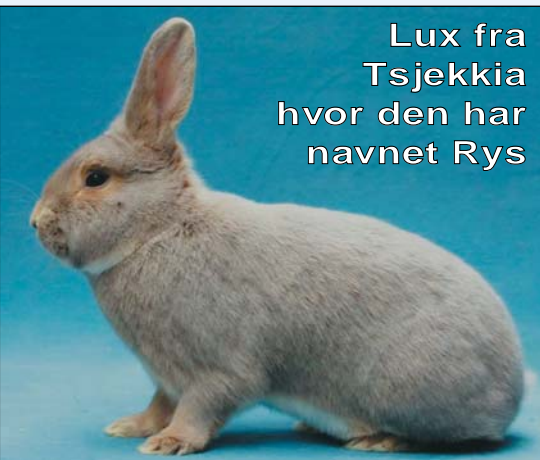
Lux fra Tsjekia hvor den har navnet Rys