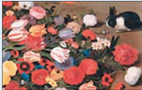
Utsnitt av maleri til kjente, Jan van Kessel fra Antwerpen (f1626-d1679)

tallet før vi finner noe om Hollender som rase. En kanin med tegninger som lignet Hollender gikk under navnet Brabacon i den nederlandske provins Brabant (ligger i Belgia). Men fra 1815-1830 var Holland og Belgia samlet i kongeriket Nederlandene. På denne tid kjøpte engelskmenn mange kaniner av rasen Brabacon og de ga den navnet Dutch Rabbit, altså Hol-