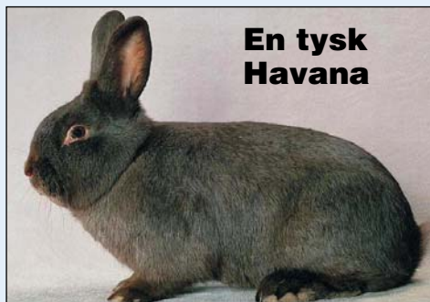
En tysk Havana

- I de fleste kaninstandarder blir fargebeskrivelsen «kun» benevnt: Mørke-brun. Men noen spesialklubber har vært opptatt av å komme frem til en fargebenevnelse, også fordi fargen varierer fra land til land. En har derfor sett litt nærmere på havana-sigarene fra Cuba. Disse papirarkene (capes) som sigartobakken rulles inn i, har nemlig et klassifisert fargedia-