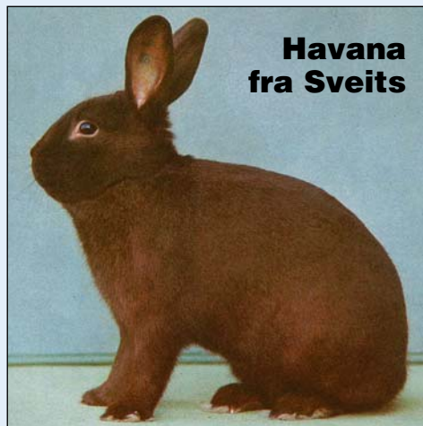
Havana fra Sveits

gram. En tar her da utgangspunkt i de tre mørkeste (capes). Den mørkeste heter Oscuro og kan sammenlignes med fargen til de tyske dyr. Maduro er den mørke brune og går for å være den korrekte, og slik som de franske Havana er.