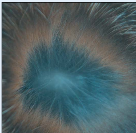
Blåser en ned i pelsen, skal det se slik ut

helt hvit på buken). Fra arvelighetsartikkel i TK 9-2012 omtales kombinasjonen Perle Ekorn X Lux og kan benyttes til å «hjelp» hverandre (men gjelder da Lux). En annen teori, for at en får noen med helt hvit buk, er at slike dyr er benyttet i avlen for å få bedre mellomfarge, og da vil en i lang tid «slite med de hvitbuka». Som oppdretter må en også være oppmerksom på fargevariasjon i dekkfargen og en vil få fram flest av de mørke, og som er den type en er ute etter. En vil