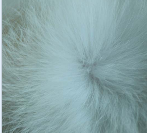
Buken til to ungdyr fra det samme kull, hvorav den ene har diskvalifiserende feil med helt hvit buk uten bunnfarge