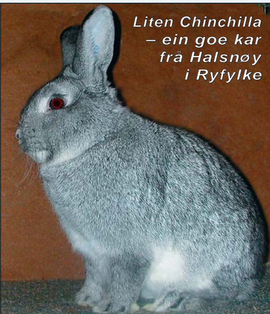
Liten Chinchilla – ein goe kar frå Halsnøy i Ryfylke