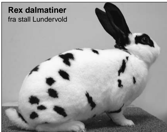
Rex dalmatiner fra stall Lundervold

Under introduksjonen av Rex, ble flere skuffet over pelskaninen - det var vanskeligheter i avlen. De mente den var mindre motstandsdyktig mot sykdom, i forhold til de kaniner med normalpels. Fruktbarheten var et problem, og dødeligheten var stor. Årsak til det sies å være den store etterspørsel, samt de høye livdyrpriser, hvor en fikk oppdrettere som tenkte mer penger, enn å avle fram levedyktige dyr. Den tyske arvelighetsforsker, professor