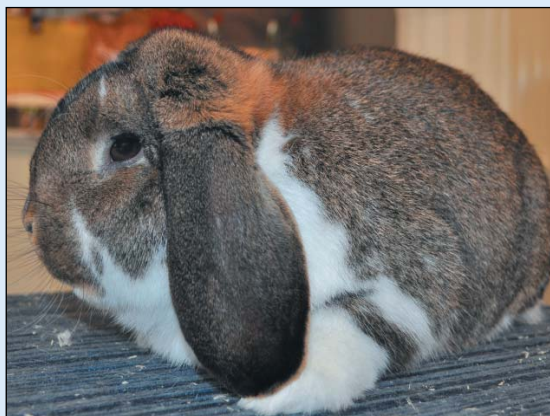
En flott hann 11mnd til Oddvar – 96p