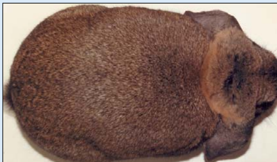
Slik skal en vedder-kropp være

Fransk Vedder ble presentert her i TK nr 7, 2011, og Liten Tysk Vedder har jo den samme eksteriørbeskrivelse, men det blir noe enkelt i en egen rasepresentasjon å kun henvise til en annen rase. Vi tar derfor å ser på det viktigste og starter med hodet, som både hos hanner og hunner er kraftig. Hannens hode er kortere og mer krummet, har god bredde og fyldige kjever. Hunnens hode er smalere, men også her gjelder det å ha kort, bred og bøynd avrundet hodeform. Halsen er meget kort og kraftig, eller en kan si den skal være «usynlig», slik at hodet sitter tett og rett på kroppen. Så var det ørestillingen: De skal henge «slapt ned» ut i fra kronen. Øverst på hodet, har vi to øreknuter, som skal være godt behåret. Når en Vedder ses