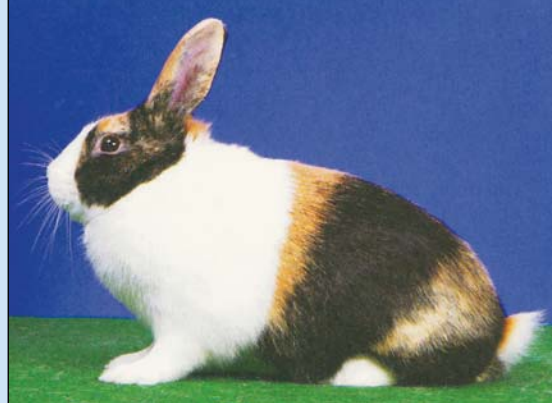
Denne er tysk, og japanervarianten av Hollender er populær i Tyskland og mange gode og vakre dyr er å se på utstillingene

slike spesielle navn for å vekke spesiell oppmerksomhet og for å få reklameverdi. England og Holland ble de første som kjøpte Japaner fra Frankrike. Til Sveits kom den i 1895 og tyskerne fikk den ca 1900. En dansk standard fra 1917 har den med. De første dyr utstilt på dansk LU, var to i 1952. Dansk LU-1990 har nok fortsatt rekorden, 33 dyr! De fleste fra den kjente dommer Benny Garly. Naturlig nok er utbredelsen sparsom, men flere land har gode dyr og ivrige avlere. På dansk LU-07