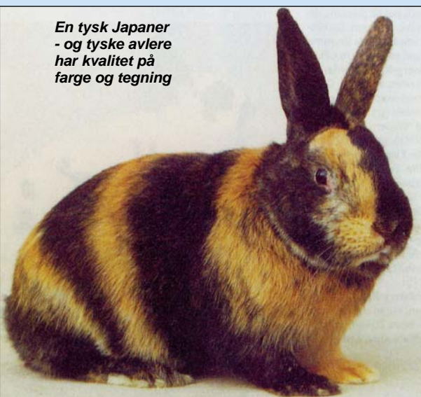
En tysk Japaner - og tyske avlere har kvalitet på farge og tegning

Og så - en liten vektjustering nylig vedtatt for Japaner: 3,01-4,5 kg=5 p.