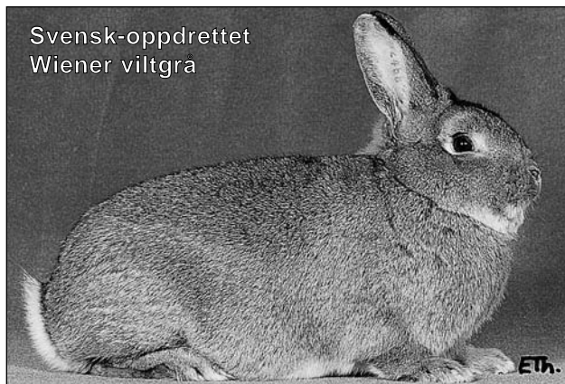
Svensk-oppdrettet Wiener viltgrå

Men rasen har også slitt med et negativt «stempel» - det var oppdrettere som fikk dyr med utslag av epilepsi. Flere oppfattet dette tegn mot arvefaktoren for blåøyet, men det kan vel ikke sies å være bevist? - og dette er vel nå avlet bort.