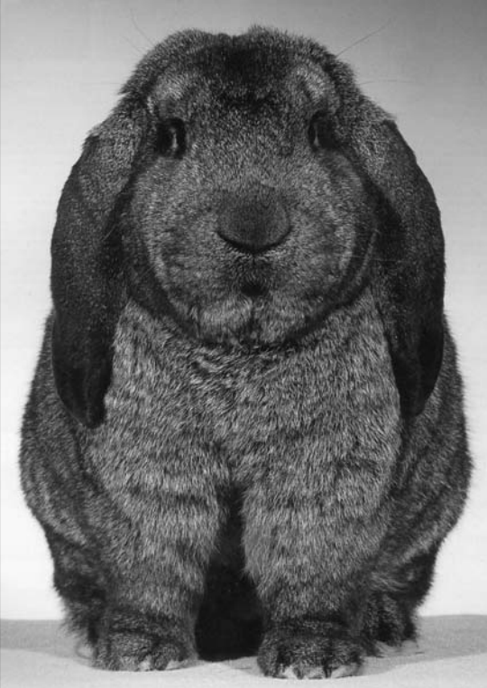
En kraftig vedder - «bull dog-type» fra Tyskland

er også ble oppdrettet i England, og det stemmer med at man i en engelsk bok fra 1822 finner noe om kaniner, som har så lange og brede ører at de ikke kan holdes oppreist. Mest tyder det på, at vedderne opprinnelig oppsto i Frankrike, kom så til England, hvor sportsoppdrettere tok fatt på å gjøre de lange ører enda lenger. Fra England til Frankrike ble de så igjen importert rundt 1840, der disse ble krysset