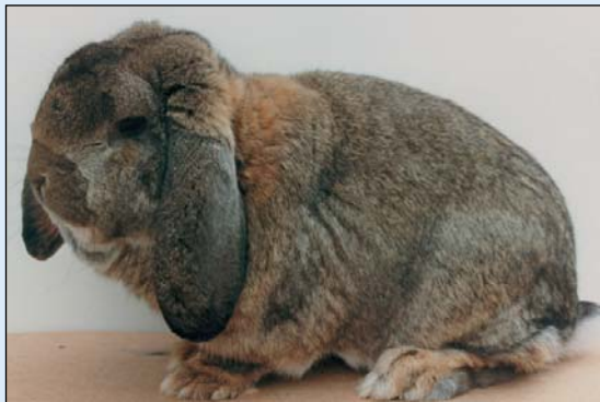
Fransk Vedder i fargen viltgrå

Men det kan være flere ting som spiller inn, som f.eks. om det også skal brukes