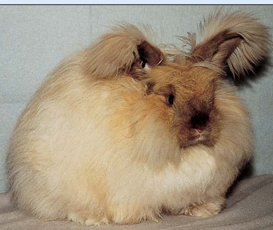
Angora i fargen rødbrun

Husk: – Kaniners fordøyelsessystem er et svakt punkt. Av dødsfall som forekommer, regnes ca 80% å være komplikasjoner i tarmsystemet. Derfor er det viktig å ta hensyn til fôrets kvalitet og måten vi