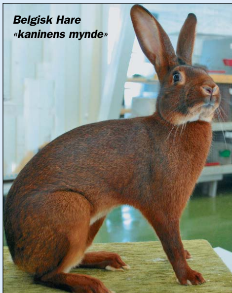
Belgisk Hare «kaninens mynde»

Kaninen liker å gnage på ting, og trives bedre med kvist og greiner i buret, som f.eks.: Einer (brake), rogn, selje eller osp. Høy er kaninens hovedføde, og sammen med vann, skal den alltid ha fri tilgang til godt høy! En kanin drikker ca 1/2 liter vann i døgnet og store raser mye mer.