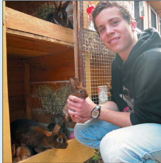
Kaniner - en trivelig og levende hobby

Meningen er jo hele tiden å avle seg frem til den beskrevne idealkanin både i eksteriør og robuste egenskaper.