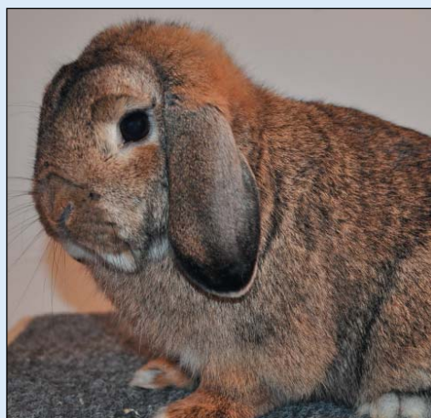
Dvergvedder i fargen viltgrå