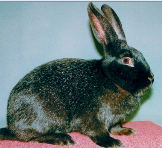
Trønder - vår nasjonalrase