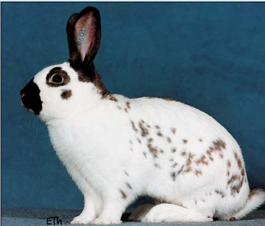
Engelsk Shecke med tegningsfarge rødbrun