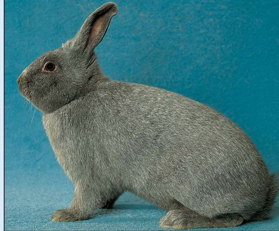
Liten Sølv i fargen blå

– Når en skal kjøpe, eller selge en ung kanin, må den være minimum 8 uker.