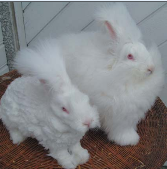
Angora ferdig klippet - og det er klart for neste

I vår norske kaninhistorie i fra 1927 kan vi lese det ble importert mange kaniner, bl.a. Angora. Rasen forsvant helt, men kom tilbake på 1960-tallet.