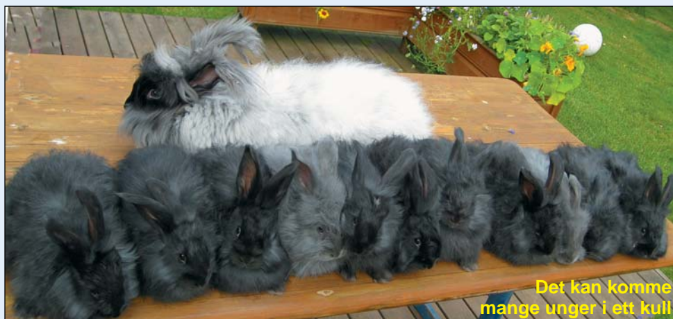
Det kan komme mange unger i ett kull

Her utstilles ett eller to bearbejdede ullprodukter med minst 75% ull fra kanin. Utstiller skal selv ha utført alt arbeidet med spinning og til det ferdige produkt. Plaggene må være tilgjengelig slik at de kan vises på rettside og vrangside. Det skal finnes sam-