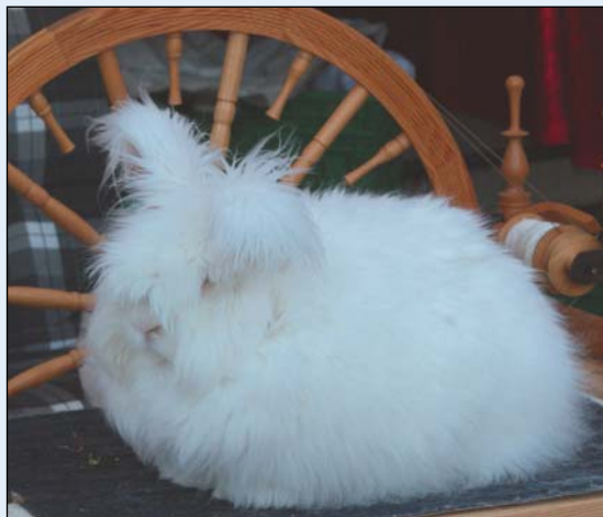
En flott Angora klar for klipping