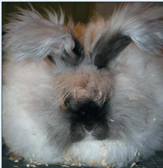
Angora madagaskarfarget (rødbrun)

Altså en Angorakanin feller ikke sin pels, og menneskene må «hjelp» den med å overleve. For hvis pelsen vokser uten å bli klippet, vil pelsmengden kvele kaninen og i vill tilstand vil den være et enkelt bytte for rovdyr når den skal «drasse» avsted med sin lange pels. De første Angora var av viltgrå farge. De fleste gir engelske oppdrettere æren for å ha fremavlet den hvite (men i Frankrike er de ikke enig) og holder på franske avlere som kombinerte anlegget mellom angora og albino og skapte de hvite Angora som klart er mest utbredt og beste ullprodusent. Angora finnes i flere