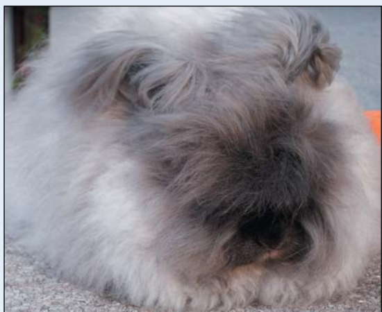
Angora i fargen svart

Ullens tetthet: Ullen skal være meget tett og dekke hele hårbunnen (huden) over hele kaninen, også buk, og over alt skal den være god og tett.