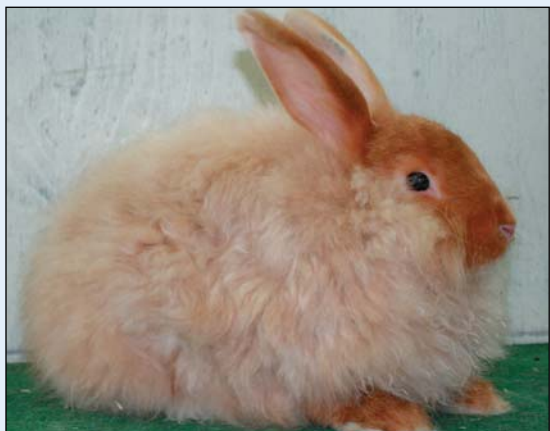
Satinangora i fargen rød

Angorapels: Ullkaninens viktigste egenkap er å produsere ull av beste kvalitet og størst mengde. Årstidene har relativt stor