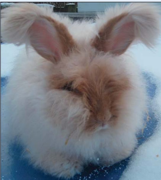
Angora i fargen gulrød

Men så tilbake til Frankrike igjen, for franske oppdrettere (også i Sveits), har egentlig allikevel sin egen Angora. Denne type har en meget større andel dekkhår og som medfører mindre filting. Den har forholdsvis kort pels på labber, hodet og ører med kun «smådusker» ytterst. Men det spesielt med denne Angora, er at ulla nappes av. Nappeintervallene kan også gå lenger tid imellom (i forhold til klippeintervaller), opp mot 120 dager. Før napping får kaninen en