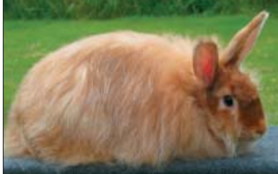
Satinangora rød (svensk dyr/foto)

Farge: Satinangora er godkjent i de fleste av Standardens beskrevne pelsfarger, men ikke i; lyseblå, lysegrå, reverød og sallander. Tegning: Godkjent i hotot og russer. Satinangora har på hode, ører og bein normalpels, og dermed skal de ha farge