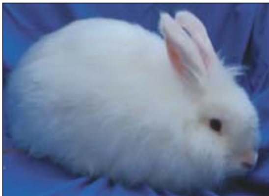
Satinangora blåøyet, ungdom

Tverrmålet/diameteren på pelshåret er tynnere enn ulla hos normal/vanlig angoraull, og ser mer glansfull ut og føles som silke. Spinning av ulla er ikke noe problem. Ulla er noe mer glattere, enn normal angora. Ulla blir helst spunnet med litt mer tvinn/vridning. Det finnes mange naturlige farger som blir en fristelse for håndspinnere.