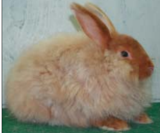
Satinangora, ungdom med ca 30 dagers ull

Satingenet er basert på en ukomplisert, «enkel» mutasjon og et «kjent» ikke-resse-