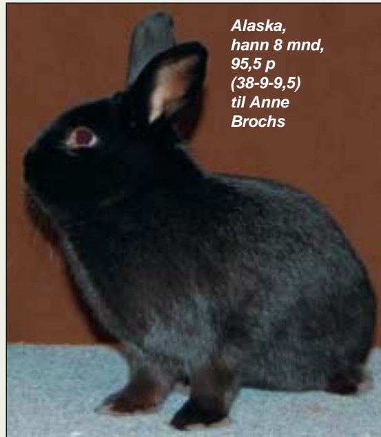
Alaska, hann 8 mnd, 95,5 p (38-9-9,5) til Anne Brochs

Anne Bjerkeli Brochs stilte med 10 Alaska og hun fikk ett dyr i 95,5 p, to dyr i 95 p og 4 dyr i 94,5 p (8 av dyra til Anne fikk 38 p i kropp)