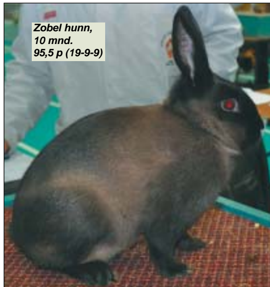
Zobel hunn, 10 mnd. 95,5 p (19-9-9)

I brun variant var det 6 dyr og hos disse er kroppsform noe svak. I Liten Sølv sort var det 61 dyr, og mange riktig gode. I en periode var jeg redd for Liten Sølv nærmest skulle forsvinne i Norge, så derfor var det en stor glede å se så mange gode