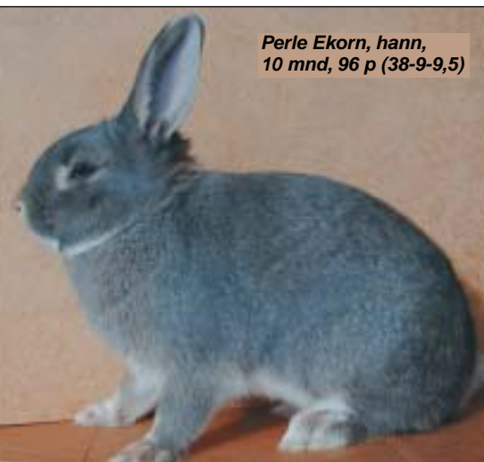
Perle Ekorn, hann, 10 mnd, 96 p (38-9-9,5)

Rasepokalen i Perle Ekorn gikk fra «øst til vest» denne gang, Bjørn Egeland hadde 1 i 96, 1 i 95,5, 8 i 95 og 4 i 94,5 poeng