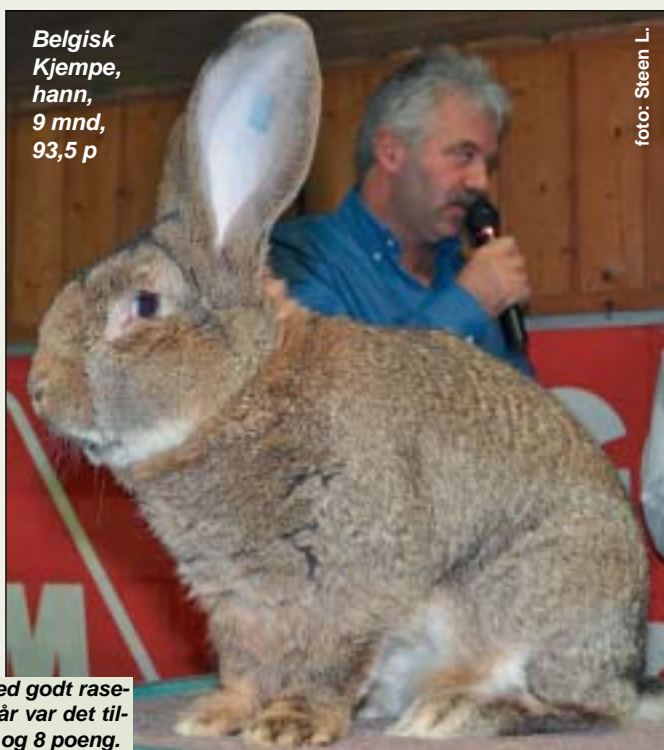
Belgisk Kjempe, hann, 9 mnd, 93,5 p

Trønder: 9 dyr fra 2 utstillere. Denne gang stilles det dyr med brukbare kropper og pels, men det kan helt klart jobbes