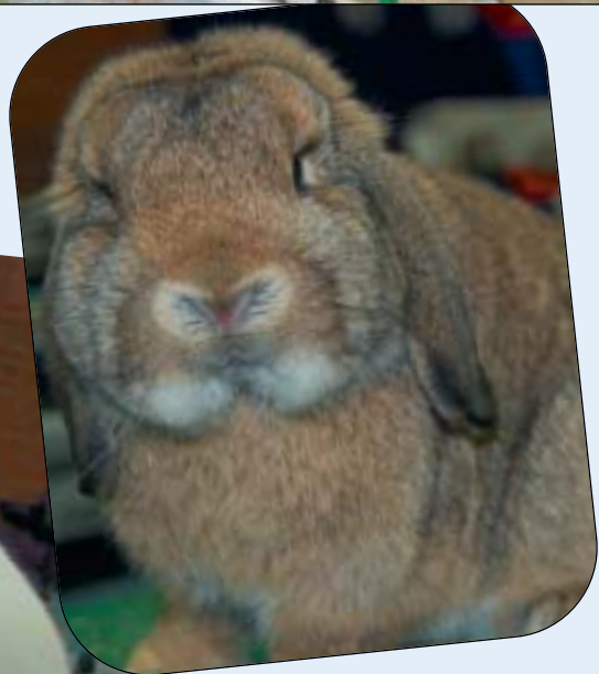
Dvergvedder hann 22 mnd, 95,5 poeng (38-9-9) til Solveig Moritsgård/ Terje Engh