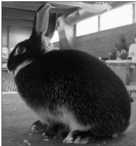
Johan Halsne stilte med 4 hanner i White og får meget god uttelling: 1x95, 1x94,5 og 2x94 p