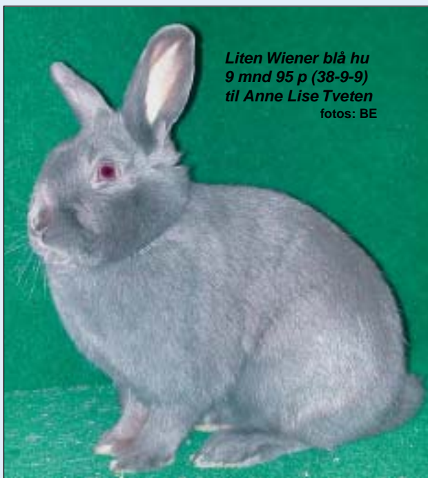
Liten Wiener blå hu 9 mnd 95 p (38-9-9) til Anne Lise Tveten