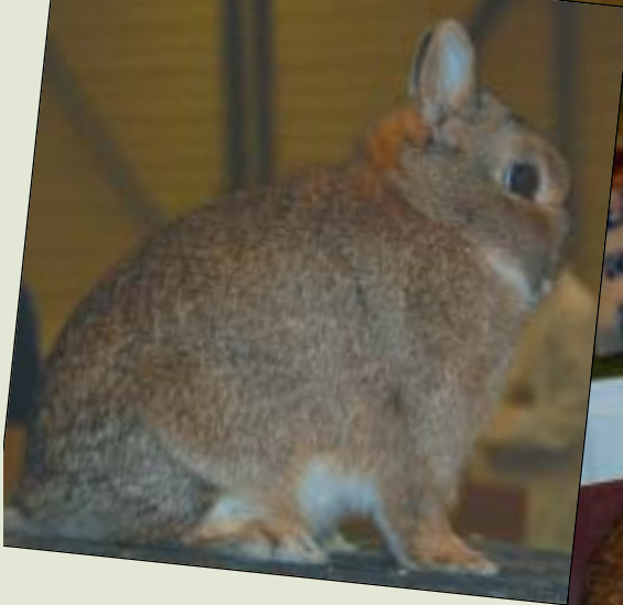
Hermelin viltgrå som fikk 95,5 p.

Belgisk Hare som fikk 95 poeng, og var den kanin som ble plukket ut blant alle 95-dyra og var da med i BiS-finalen og ble der nr 7, og der deltok altså 4 dyr som hadde fått 95,5 poeng og de to Dvergvedderne som som fikk 96 poeng.