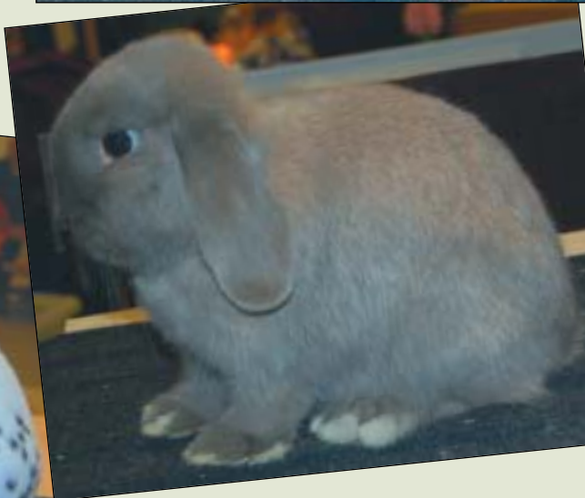
Dvergvedder isabella som fikk 95 p.