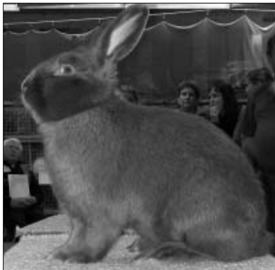
En kan vel si at det ikke var noe å utsette på Kai Tvetens Blå Wiener under BiS-uttaket - det var små marginer med en jevn finale

Blå Wiener: 12 dyr fra 2 utstillere, hvor Kai Tveten har 8 fantastiske dyr og hvor Kai får denne serie: 1 i 96, 3 i 95 og 4 i 94,5 poeng, og det blir 1,2 med 286 p. Nok en gang er dermed Kai med å kjempe i toppen, og det blir sølvmedalje. Rasens gjennomsnittspoeng blir 94,38.