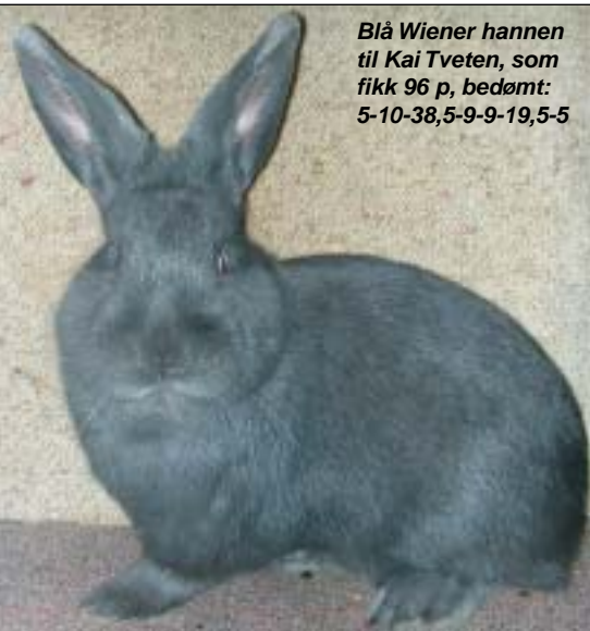
Blå Wiener hannen til Kai Tveten, som fikk 96 p, bedømt: 5-10-38,5-9-9-19,5-5