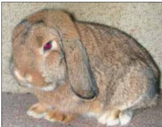
Dvergvedder 1,0 4 mnd, 96 p, til Merethe Engh