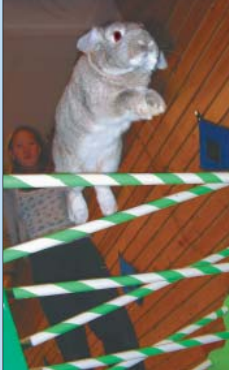
Thea Mei Yu ble NM-vinner med Skogbakkens Ch Rummy