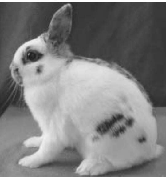
Nordisk premiere for rasen Dvergschecke, tilhørende Bjørnar Gundersen - fikk 93,5 p.