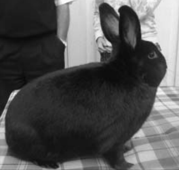
Under dom sista åren har Johnnys Alaska skördat väldiga framgångar i Norge. På bilden ser vi en av Johnnys vackra avelshonar

stall och här hade det sannerligen inte sparats in på något. Stallet var tredelat (kaniner, fåglar och duvor) med en stor ljus och fin arbets/fodergång längst bak. I kanindelen fanns det huvudsakligen Perle Egern, men också Hermelin vit rödögd och Dvärgvädur viltgrå.