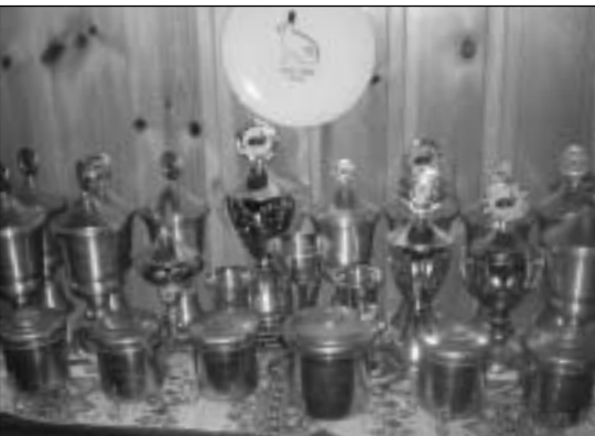
Delar av familjen Tvetens prissamling, som vittnar lite om alla framgångar. I källaren fanns dessutom en vägg full med rosetter, en av dessa var Kais favorit, den var nämligen från Sveriges allra första LU i Örebro 1985

stall och här hade det sannerligen inte sparats in på något. Stallet var tredelat (kaniner, fåglar och duvor) med en stor ljus och fin arbets/fodergång längst bak. I kanindelen fanns det huvudsakligen Perle Egern, men också Hermelin vit rödögd och Dvärgvädur viltgrå.