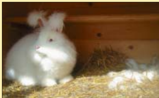
Pernille i sin hantverksbod. Här kunde man köpa angoragarn av högsta kvalitet, dessutom så fanns det en hel del produkter, en av bästsäljarna var bebisstrumpor av angoraull. Over: En mycket rastypisk Angorahona vakar över sitt rede med ungar i sensommarsolen. Observera sitthyllan i burfacket