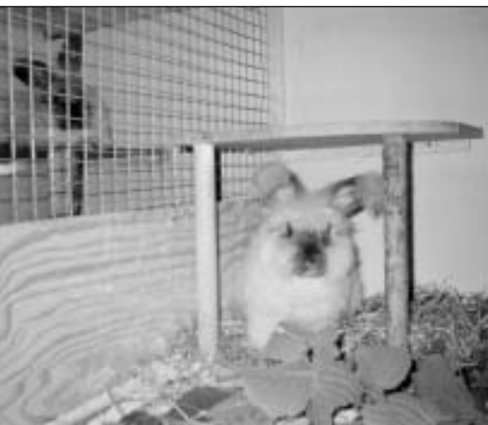
Angorakaninene koser seg med hassel

Kaninene er i fin form og ullen ser fin ut. Når det gjelder føring, så prøver jeg nå ut et lamme-/kalvefôr. Dette som ser ut som en frokostblanding, men kaninene spiser det med god appetitt. Ved siden av får de høy av årets avling, pluss grener fra hassel, osp og selje som de og liker godt. Enkelte kaniner gnager barken av grener, mens andre bare spiser blader. Vann får de nytt hver dag. Jeg bruker drikkeflaske til hver kanin. Noen drikker ca 2,5 desi-