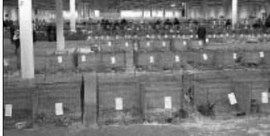
Oversikt over hallen, med kjempene foran, plassert i bur rett på gulvet. Flest dyr var å se i Hermelin med 484 og Dvergvedder med 324.

(5) marsvinutstilling og (6) papegøyer i ulike farger/varianter, foruten fiskedam, bilbane, ponniridning for å nevne noe. Vi nordmenn stusset vel på at det var matservering blant ildere, ponnier og slanger. Men for all del, hallen hvor kaninene var så ut til å være godt besøkt. Kaninene var plassert i to høyder, utenom kjemperasene som hadde bur plassert på gulvet. Litt uvant, men det ga en god oversikt. Den rasemessige fordelingen er ikke så veldig forskjellig mellom Sverige og Norge, men som nevnt, er det stor andel, større enn hva vi er vant til, av dvergrasene. Det som var litt artig å se igjen var Engelsk Vedder (hadde selv rasen for en del år tilbake og den har også vært å se på danske LU'er). I år som i fjor var det Kjell Carnbrand og Peter Landberg som vant med Belgisk Hare og igjen fikk de ett dyr med den fan-