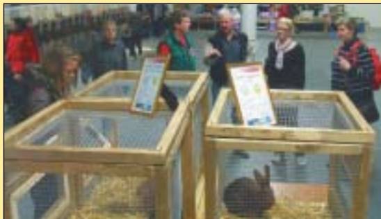
Toppsyrene ble satt fram i egne bur

dvergrasene. - Det var veldig mye folk i messehallen, og jeg tror de fleste befant seg i den delen av hallen hvor det var mange andre ting som foregikk. Der kunne man se: (1) klipping av sau, spinning av ull og toving, (2) oppvisning av ildere, samt bedømming av disse, (3) slanger, øgler etc., (4) bedømming av ørkenrotter,