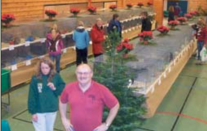
Så var det igjen klart for utstilling på Tjodalyng