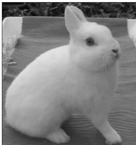
Nytt av året er Hermelin hvit rødøyet