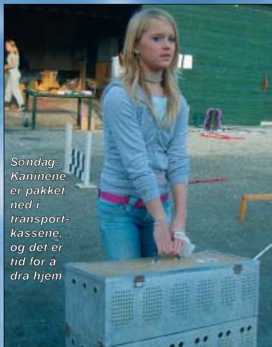
Søndag: Kaninene er pakket ned i transport- kassene, og det er tid for å dra hjem