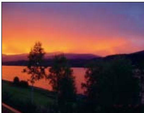
Kortgarden august 2006, utsikt fra verandaen

LUU på Oppdal i 1991 var den absolutt første utstilling vi stilte på og da var det jeg og de to midterste barna som stilte