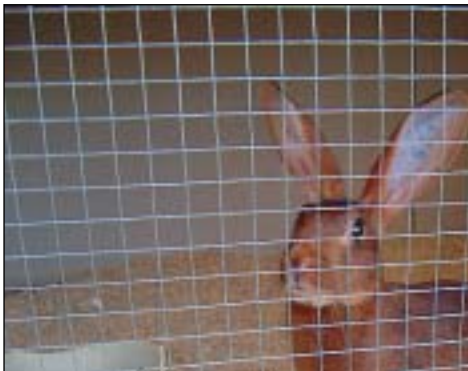
Blomstene utforbi kaninstallen

Som nevnt, startet det med to Angora. På det meste var jeg oppi 16 Angora, og det var mye arbeid. Her må en jo være nøye med rengjøring og pelsstell, slik at ikke ulla blir skitten og at ulla ikke tover og