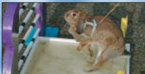
Over: Lisbodall Skippy - selv en NM-vinner kan være uheldig. Noen fikk seg også en ridetur på ponnie