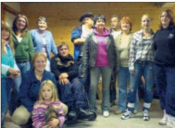
Bildet øverst: «Utstillingsgjengen» som var med på arrangementet av høstutstilling på Gjermundnes Videregående skole, i helga 29., 30. september og 1. oktober 2006. Bildet under: Dette er 3 av vedderne til en elev på skolen, som kan hoppe rundt å kose seg i en stor innhengning på ca 2x4 meter.

Noen av elevene mine fikk en rask runde i lokalet på søndag for å se på de ulike rasene, samt få et innblikk i hvor store noen av kaninene er. Belgisk Kjempe var rasen som falt i smak hos dem, for de hadde enorme ører og var jo så «søte og