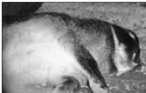
Ikke død White, men den ble varm i sommer!

Ja, som nevnt i innledningen, meldte jeg meg inn i laget høsten 1991. I januar 1992 ble jeg valgt inn i styret og siden har jeg vært der. Først noen år innen forskjellige «småoppgaver», fram til 1996, da jeg ble