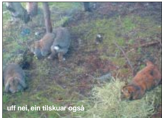
uff nei, ein tilskuar også