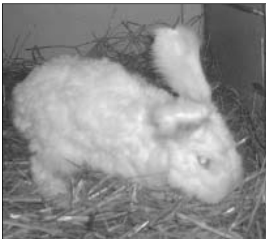
Ja nå såg ho pjuskete ut! - Nyklyppa Angora tål ikkje kulde, så då er det bra med innestall

bladverk til føring av dyra. Ikkje det at dei ikkje har fått grønt fôr i løpet av vinteren. Her eg bur har eg ingen vanskar med tilgangen av grønt fôr. Omgjevnaden her på landet held på å gro igjen av trær og busker. Eine vert flittig nytta om vinteren,