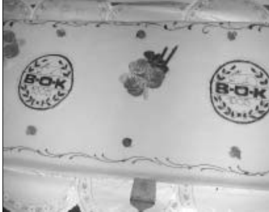
og så fikk vi diger Jubileums-marsipankake