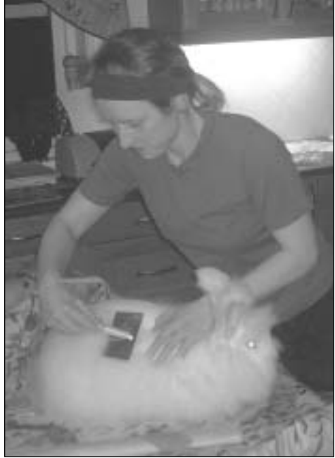
og så skal vi i gang med å klyppa vårt nyinnkjøpte næste. Først var det børsting . . .

vi/eg kjøpte har nå fått seg eit klipp og det tok si tid! - ca 2 timar. Eg holdt og kona klippte, så vi brukte vell eigentleg ressursar på 4 timar. Vi har berre den eine så vi får spare litt ull eller kjøpe fleire før vi går vidare med kjøp av rokk og anna utstyr. Ein Angora-kanin er nå ei begynn-