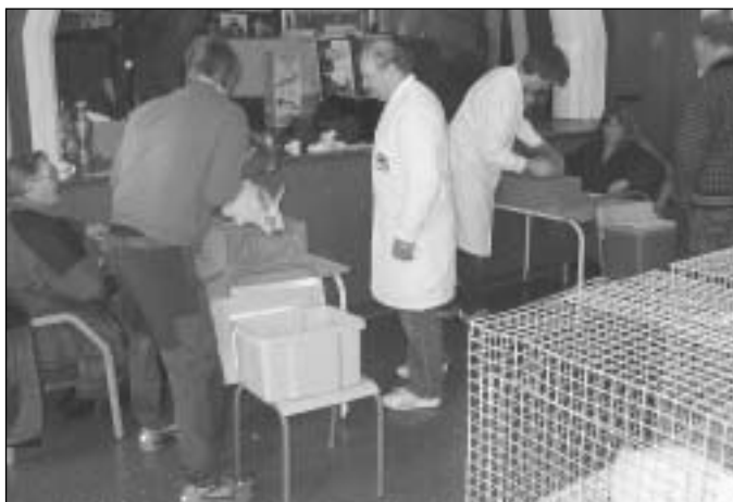
Skrivere, bærere og dommere i arbeid på «Flimra»