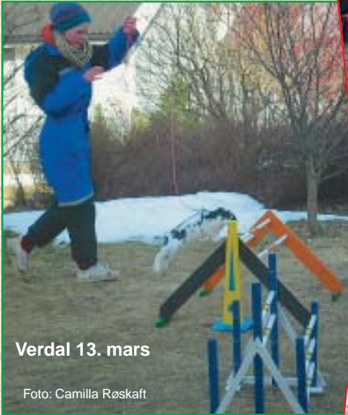
Verdal 13. mars