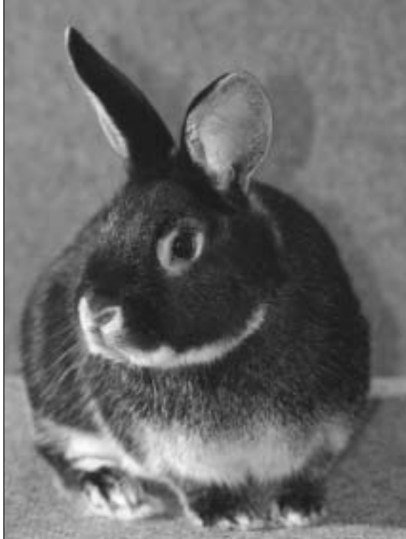
White, 94 poeng, til Niels J. Møller, Farsø, som tok napp i rasepokalen med 3,1 i 374,5 poeng.

En i 96,5 - to i 96 og 17 i 95,5 poeng Av toppdyr, var det utenom nevnte Tysk Kjempeschecke i 96,5 poeng, en Engelsk