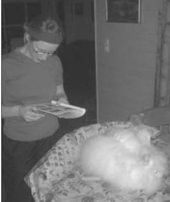
så var det ferdig og nøstet ligg der med midt-skill, klar for klypp. - Men kva står nå her då?

bladverk til føring av dyra. Ikkje det at dei ikkje har fått grønt fôr i løpet av vinteren. Her eg bur har eg ingen vanskar med tilgangen av grønt fôr. Omgjevnaden her på landet held på å gro igjen av trær og busker. Eine vert flittig nytta om vinteren,