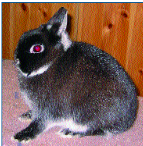
Hermelin zobel&white, 94 p.