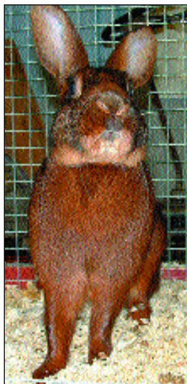
Jeg var fineste kanin på Kalnes (fikk 9,5 p i farge)

Utstilling Sarpsborg 12.-14. mars Utstillingen ble som vanlig avholdt på Kalnes. I alt ble det 182 påmeldte kaniner i kl. A og kl. C for junior. Publikumsoppmøtet var stort, og noe av dette må vel skyldes god annonsering med bl.a. NKFs fine plakater. Vi setter stor pris på at mange foreninger er representert, og det