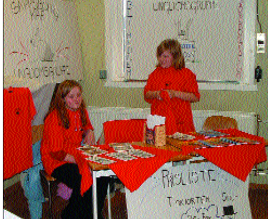
Ungdomsgruppa vår hadde egen stand