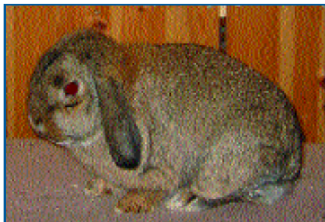
Beste Dvergvedder, 94,5 p., til June Hadland

sidene, ja faktisk helt nede mot white-tegningen som også bidro til å dempe overgangen. Dyktig inngripen av overdommer Thormod Saue, som la listen hvordan dette skulle bedømmes ga trekk i zobeltegningen, mens whitetegningen var god. Dermed fikk 4 dyr tildelt 94 poeng. Gode rasetypiske dyr med gode kropper bidrar til at interessen for videre avl fremdeles er håpefull.