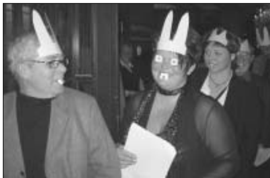
Etter mat og medaljeutdeling var det på med «pynten» - og opp til kaffe og svingom