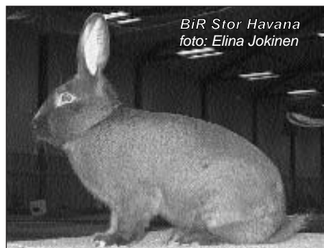
BiR Stor Havana

Stor Havana: 11 dyr med gode kropper og pels, de fleste var noe uferdige i fargen