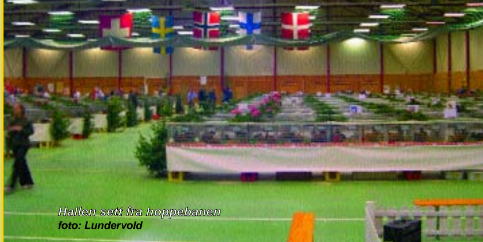
Hallen sett fra hoppebanen