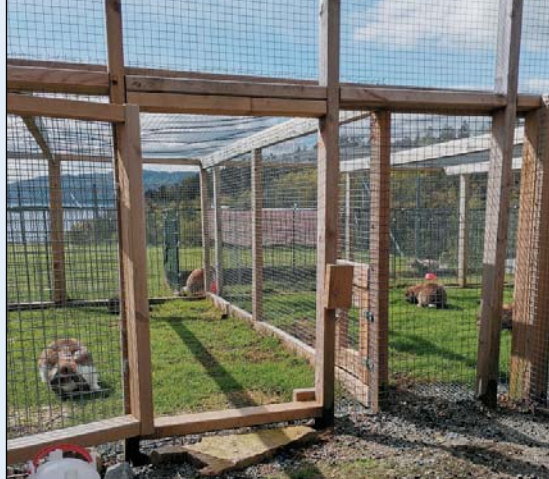
Innhengningene er solid bygget og her må en vel si det er «store dimensjoner»

oppfordring og et ønske om en nettside som er mer informativ i forhold til kaninhold og oppdrett, ved å kunne gå inn på nettsiden og søke opp den informasjon en er ute etter.