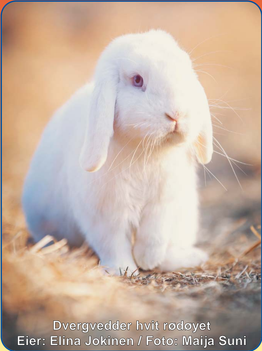
Dvergvedder hvit rødøyet Eier: Elina Jokinen / Foto: Maija Suni

Returadresse: Petit Grafiske Frøyerv. 46, 4328 Sandnes