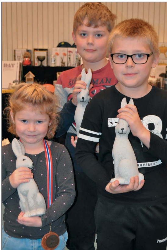
Meget viktig å inkludere juniorene

Vi gjør det vi kan for å være synlig gjennom digitale plattformer i sosiale medier. Interesserte må lett kunne finne relevant informasjon. Hjemmesiden vår fungerer godt og understøttes av publiseringer i sosiale medier. Samtidig må vi få fart på å arrangere utstillinger. Gjør vi utstillingene godt kjent og tar godt imot de som kommer innom til arrangementene våre? For, det med å hilse på og å prate med publikum er viktig. Forklar for de besøkende både om målet med hobbyen og hvorfor vi finner rasekaniner så spennende. Og gjerne litt om rasenes egenskaper.