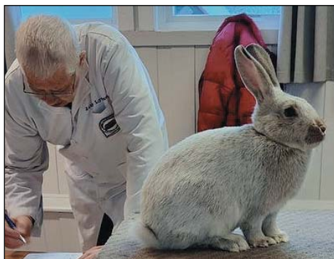
En staselig Stor Sølv viltgrå tildeles 95p