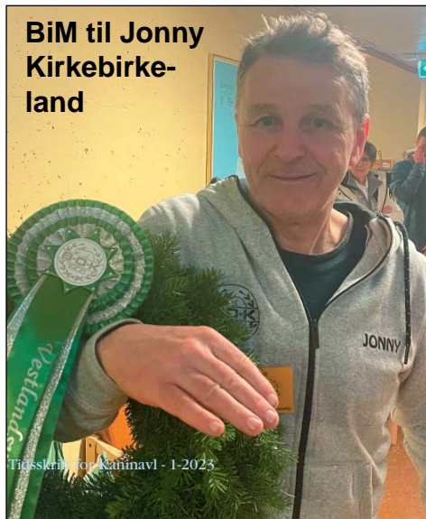
BiM til Jonny Kirkebirke- land