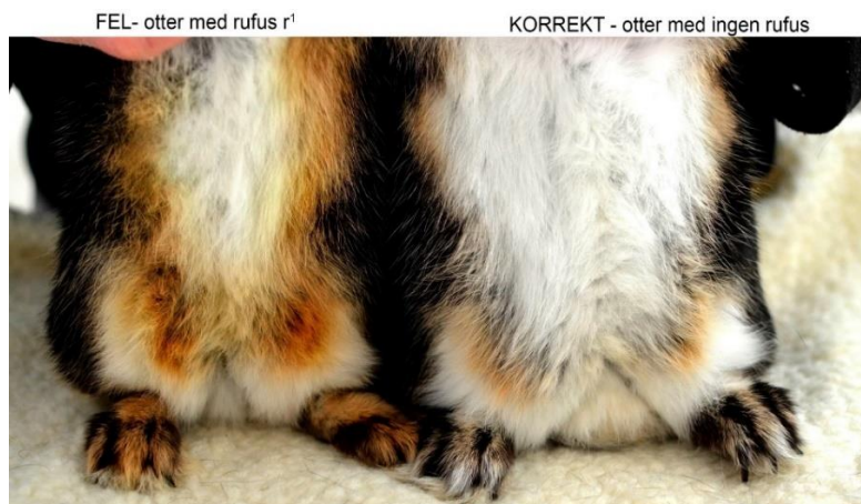
OBS! Färgen på sidorna och tassarna vänster med rufus och höger ingen rufus